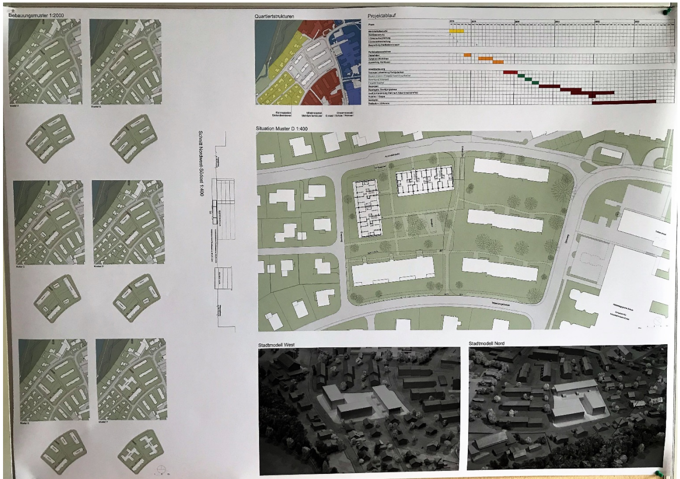
Machbarkeitsstudie, Zeitplan (Gautschi, Lenzin, Schenker Architekten)